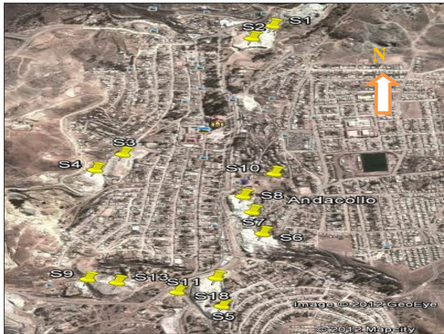
Fig. 1: Se presentan los principales sitios (s) donde se encuentran los relaves presentes en la ciudad de Andacollo y los puntos de análisis de la presencia de mercurio, (Fuente: Google Earth, 2012).

Para la determinación de la cantidad de materia que se encontraba en cada torta de relave se procedió a medir el área, la altura y la densidad de cada torta.